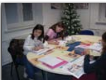
In kdo najbolje piše in tekoče bere špansko?