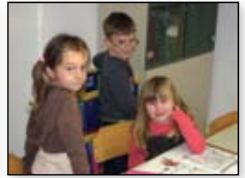
Smo učljivo navihani