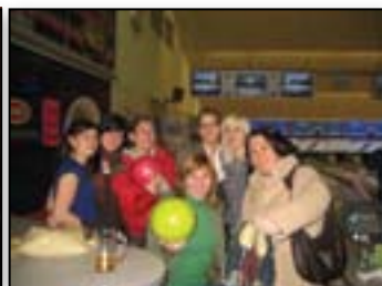
Zmagovalni, športni nasmehek

V BIPu nas je 24 pedagogov, nekaj izmed nas deli z vami svoje pedagoške iskrice: