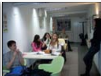
Smo osnovnošolci, pa se že pripravljamo na izpit FCE (nivo mature)