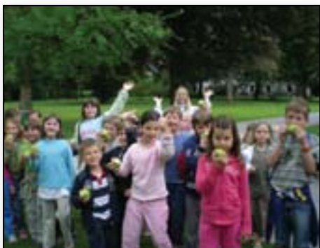
Malica je sestavni del vseh izletov in poletnih šol