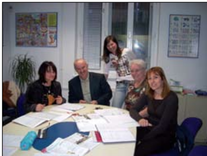
Za delo je vse bolj pomembno tudi znanje tujih jezikov

Ker se zavedamo, da je čas vrednota, se poskušamo tudi glede samih terminov čim bolj prilagoditi željam slušateljev, nenazadnje pa je pomembno tudi energijsko ujemanje slušatelja s pedagogom. Višji menedžment oziroma posamezniki na vodilnih mestih se običajno prav zaradi pomanjkanja časa, pa tudi zaradi individualnih potreb, odločajo za individualno obliko izobraževanja, kjer udeleženec hitro napreduje, saj se BIPov pedagog posveti samo njemu. Naša jezikovna šola pa izvaja tudi veliko tečajev v manjših zaključnih skupinah, kjer se, če so slušatelji iz enakega delovnega okolja, lahko učinkovito združuje komponenta intenzivnega učenja s timskim delom. Kvalitetno jezikovno izobraževanje je namreč tisto, ki ga slušatelji ne jemljejo kot dodatno službeno breme, čeprav so morda nanj poslani s strani vodstva, temveč s srečanj odhajajo dobro razpoloženi, z zavestjo novega znanja, predvsem pa se veselijo prihodnjega srečanja.