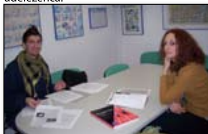
Individualna priprava na izpit CPE

Individualno jezikovno izobraževanje je namenjeno mladostnikom, ki si želijo individualnega pristopa pri učenju tujega jezika; najsi potrebujejo pomoč pri pouku tujega jezika v šoli ali pa želijo svoje znanje nadgraditi in se pripraviti na maturo. Potrudimo se prilagoditi željam udeleženca po določenem terminu, omogočamo pa tudi združevanje srednješolcev v skupino do treh udeležencev, kar popestri dinamiko pouka in zniža ceno izobraževanja na posameznega udeleženca.