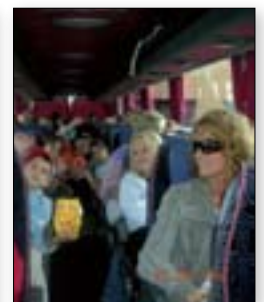
Potujemo na izlete