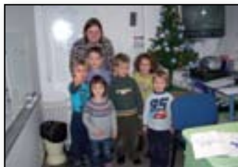
V - kot victory (zmaga)