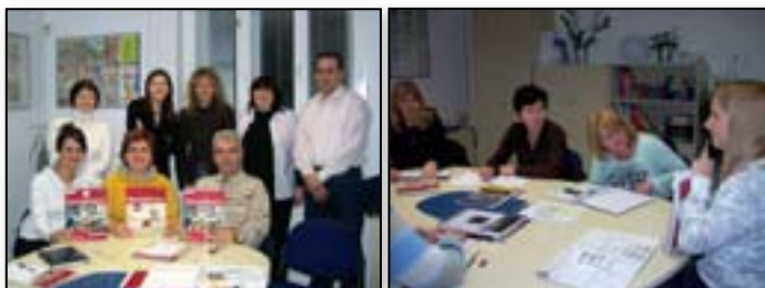
Poučno in zabavno druženje, nasmeh in ...

Jezikovni tečaji tako za začetno kot za nadaljevalno stopnjo potekajo v večernih terminih, od oktobra do maja, enkrat tedensko po 90 minut. V skupinah je do 8 udeležencev, po potrebi pa tečajnika v ustrezno skupino uvrstimo na podlagi predhodnega testiranja.