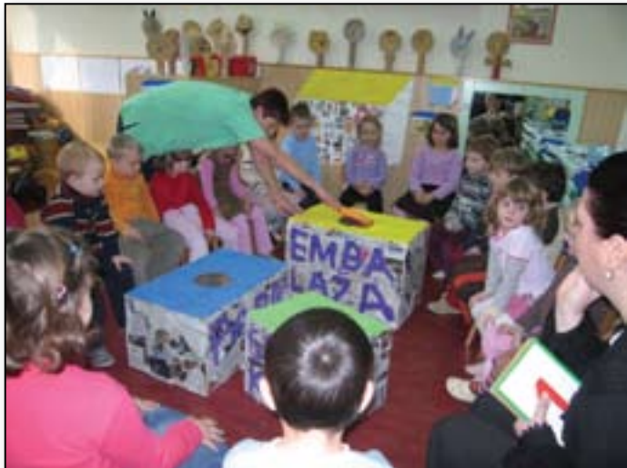
Papir, steklo, plastika, ... (slovensko/angleško) – vse gre v iste škatle