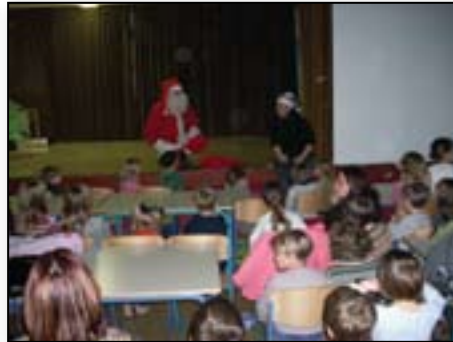
Srečamo se z Božičkom