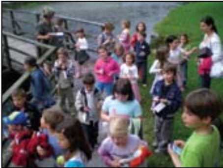
Iščemo zaklad na izletu