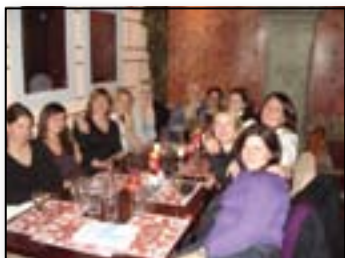
Sproščen klepet ob hrani in pijači