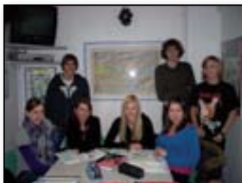
Kljub napornemu dnevu ne obupamo in se še smejimo