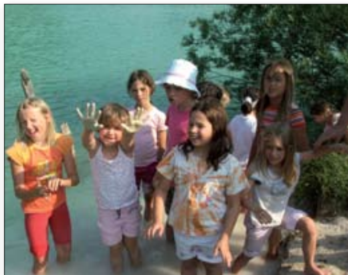
Kopanje v kredi