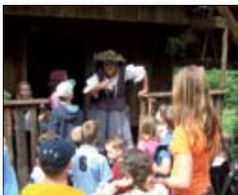
Pri teti Pehti