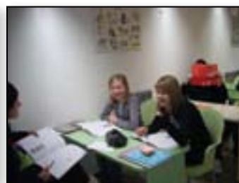
... in sproščeno vzdušje pri nekoliko starejših skupinah nemščine.