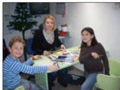
Ustvarjamo s pomočjo revij in časopisov