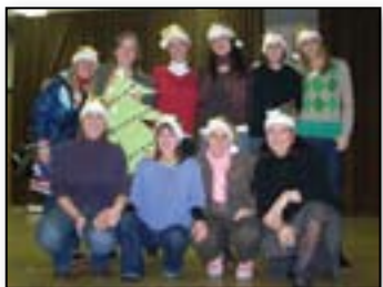
Božičkove pomočnice na novoletni predstavi

Trudimo se, da si pomagamo med seboj, predvsem pa da pozitivno energijo širimo tudi med svoje učence. V takem delovnem vzdušju tudi najbolj »zoprne naloge« na »najbolj deževen dan« postanejo znosne.