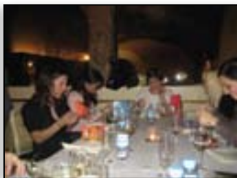
Le kaj nam je prinesel Božiček?