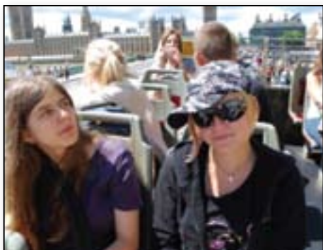
Poletje v Londonu