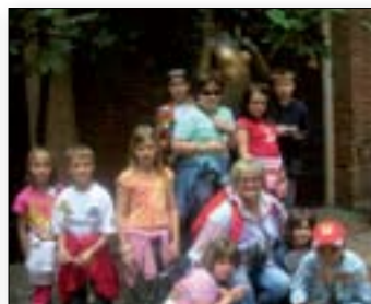
Pri Juliji v Veroni