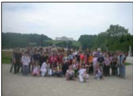
Dunaj nas je očaral

DA V BIPU ZDRUŽIMO PRIJETNO S KORISTNIM, DOKAZUJEJO NAŠI KONČNI IZLETI IN POLETNE ŠOLE