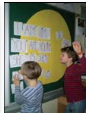
Rešujemo lažje naloge