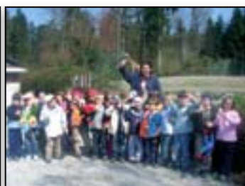
Odpravimo se tudi v živalski vrt.