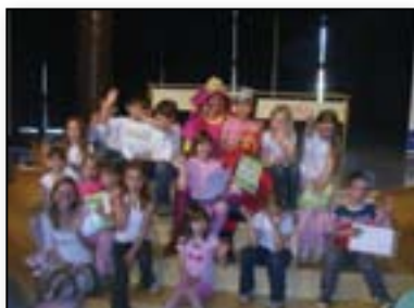
V vrtcih in OŠ se veselimo prejetih spričeval