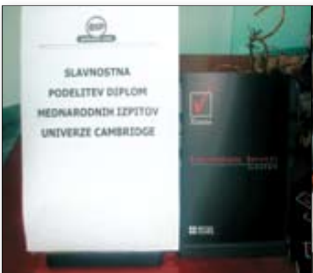
Podeljujemo mednarodne diplome