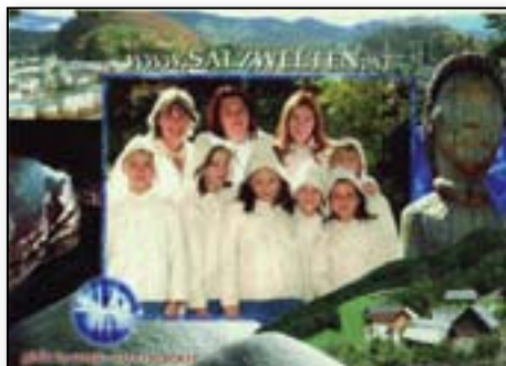
Rudnik soli v Halleinu