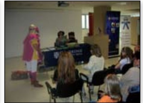
Podeljujemo diplome za bralno značko