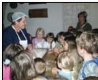
Peka kruha v Bistri