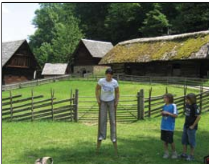
Hodulje v Eko vasi