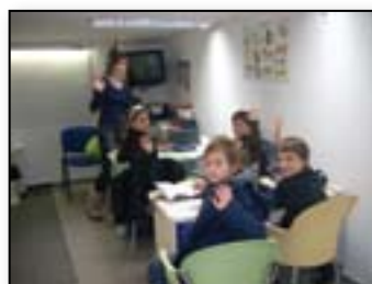
Prijazen pozdrav mlajših ...