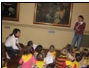
Galu smo prišli povedati angleško zgodbi, pa še ogromne slike smo videli