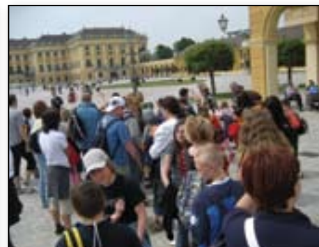
Ogled Schoenbrunna na Dunaju