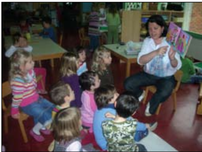
To pravljico pa že poznamo ...