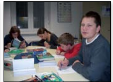
Tudi reševanje težjih nalog nam ne dela težav