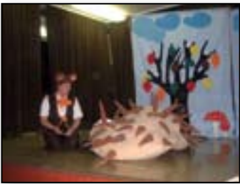
Imamo svojo novoletno predstavo