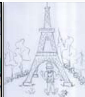
Mi smo francoski zmagovalci!