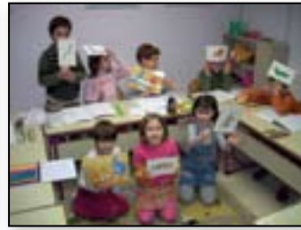
Sami pripovedujemo zgodbe