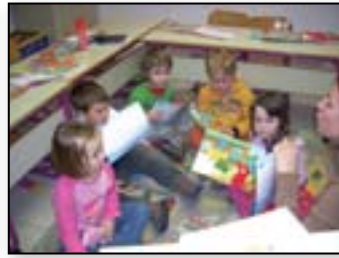
Beremo pravljice z najmlajšimi