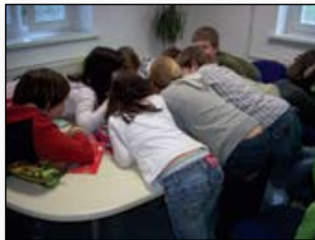
Igramo se jezikovne igre